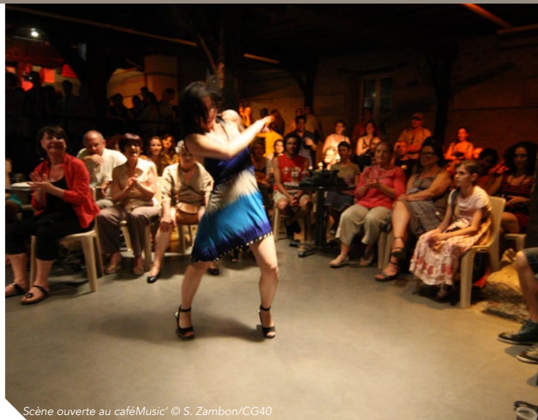
Scène ouverte au caféMusic'

📍 Emplacement des établissements participants situés sur le plan.