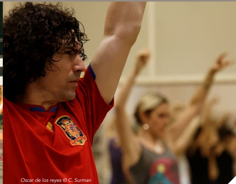
Oscar de los reyes