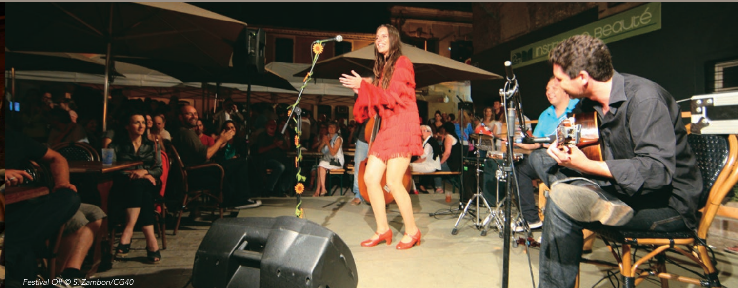
Festival Off